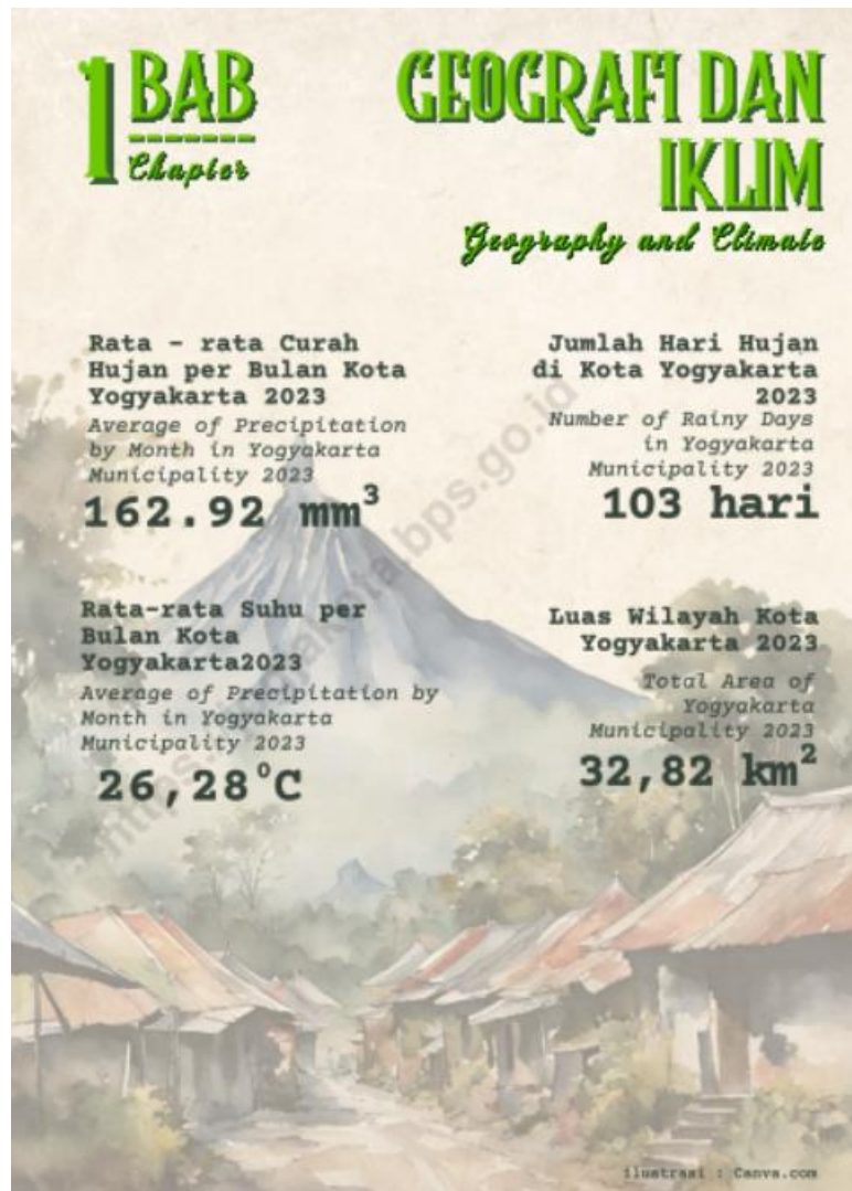
Gambar 2 Geografi dan Iklim