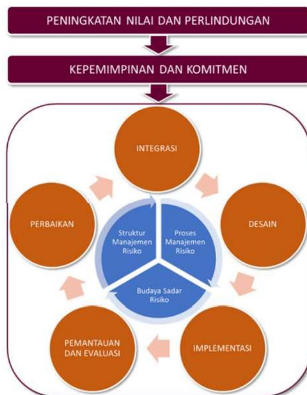
Gambar 2.1 Kerangka Kerja Manajemen Risiko SPBE

Komponen dasar dari kerangka kerja ini terdiri atas prinsip mengenai peningkatan nilai dan perlindungan, kepemimpinan dan komitmen, serta proses dan tata kelola Manajemen Risiko SPBE sebagaimana terlihat pada Gambar 2.1.