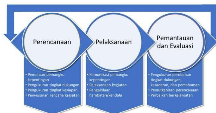
Gambar 4.2 Langkah Pengembangan Budaya Sadar Risiko SPBE

Langkah-langkah pengembangan budaya sadar Risiko SPBE dapat dilihat pada Gambar 6 di bawah ini.